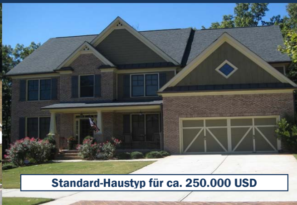
Standard-Haustyp für ca. 250.000 USD