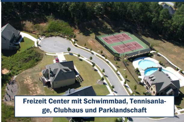
Freizeit Center mit Schwimmbad, Tennisanlage, Clubhaus und Parklandschaft