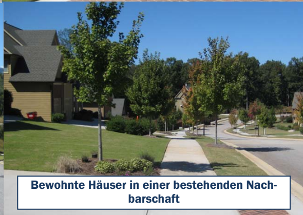
Bewohnte Häuser in einer bestehenden Nachbarschaft