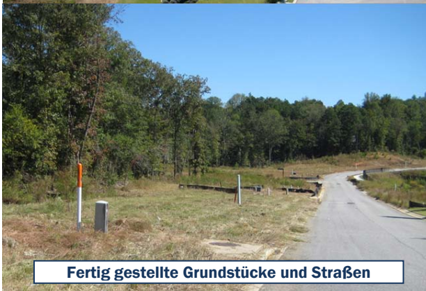
Fertig gestellte Grundstücke und Straßen